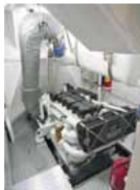
Il motore Cat a centro barca, molto potente.