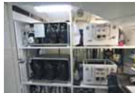
I dissalatori e i sistemi per il condizionamento.