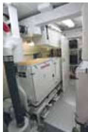
I due generatori da 45 kW in sala tecnica.