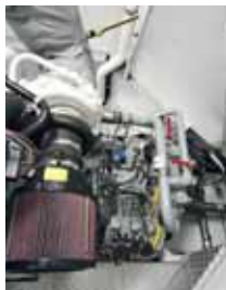
Il sistema idraulico Servogear che regola la trasmissione.