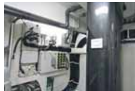
Altri impianti, non manca un inclinometro da deriva sull'albero.